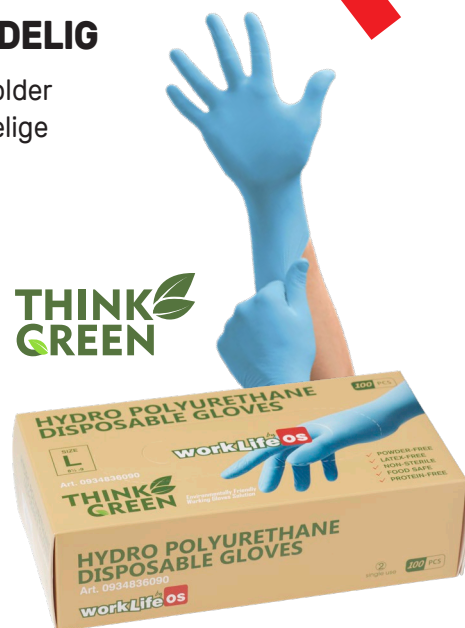
Emballagen er produceret af genbrugspap med vandbaseret tryk.

Det vandbaserede PU-materiale og Think Green teknologien betyder at handsken nedbrydes 70% på kun 45 dage, i naturen.